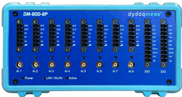
dydaqmeas mit 8 analogen Eingängen, digitalen I/O und leistungsfähigem ARM® Prozessor

Jedes dydaqmeas Messsystem ist gleichzeitig ein leistungsfähiger Edge Computer mit integriertem Webserver. Alle Funktionen sind über die moderne Weboberfläche in einem Browser einzurichten und zu verwalten. Über individuell gestaltete Dashboards können die Messdaten überall auf der Welt in einem Webbrowser angezeigt werden.